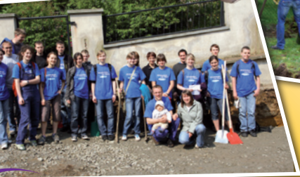
Jojo aus Ebersbach in Bautzen:

Slogan wollten wir zeigen, dass junge Christen keine Schlaftabletten sind, sondern sich engagieren. Und es waren schweißtreibende Stunden, aber es hat sich gelohnt. Die Aufgaben waren sehr unterschiedlich: Unkraut beseitigen, Zäune streichen, Müll sammeln, Sandkastengrube ausheben, Toilettenhäuschen verschönern, Steine stapeln und vieles mehr. Gemeinsam und in guter Atmosphäre ging es ordentlich vorwärts. Hier einiges im O-Ton: