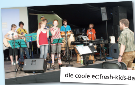
die coole ec: fresh-kids-Band