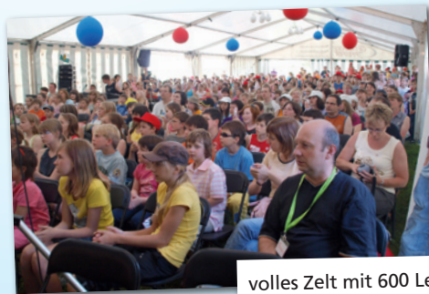
volles Zelt mit 600 Leuten